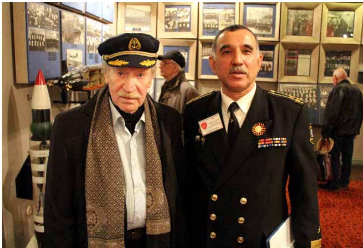
Очередное знакомство с экспозицией музея

Торжественная часть проходила в лекционном зале музея ВВМУ ПП, где собралось около семидесяти участников с учётом присутствовавших курсантов школы мичманов.