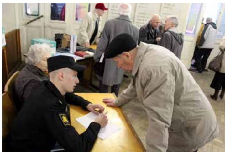
Регистрируется контр-адмирал Даньков Ю.Н.