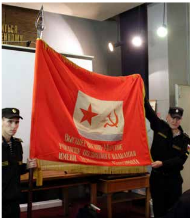
Знамя Высшего военно-морского училища подводного плавания на торжественном заседании 12-й Всеподготской встречи 24 сентября 2016 года

Знамя впервые представлено после длительного хранения в запаснике и реставрации. Оно будет выставлено в музее как ценнейшая реликвия.